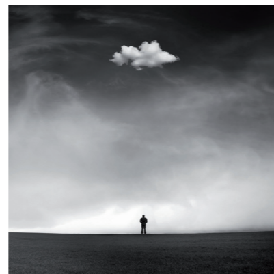
Asier Garagarza - Trofeo Argizaiola

Domingo 29 de octubre a las 10:30h. Atrio Azkuna Zentroa. Cada niño traerá su cámara y le daremos una workshop de composición básica para salir a realizar un pequeño rally fotográfico por la zona posteriormente recogeremos las imágenes realizadas para hacer una selección y ponerlas en la Web del Festival y les daremos un Vale por un valor de 10€ para realizar cualquier trabajo en Saal-digital. Sin coste de inscripción (plazas limitadas).