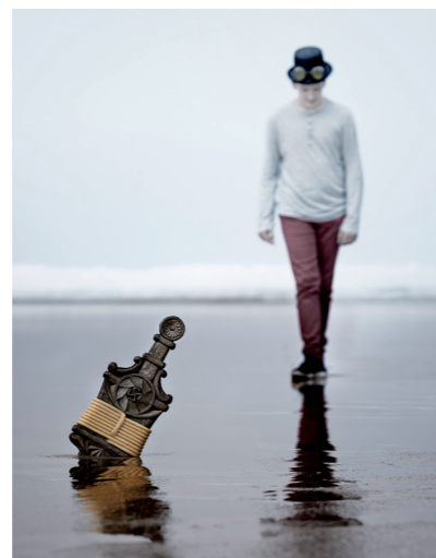
Argizaiola Trofeoa 2017