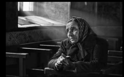
Argazkia: Pray - Jose Beut - Valencia