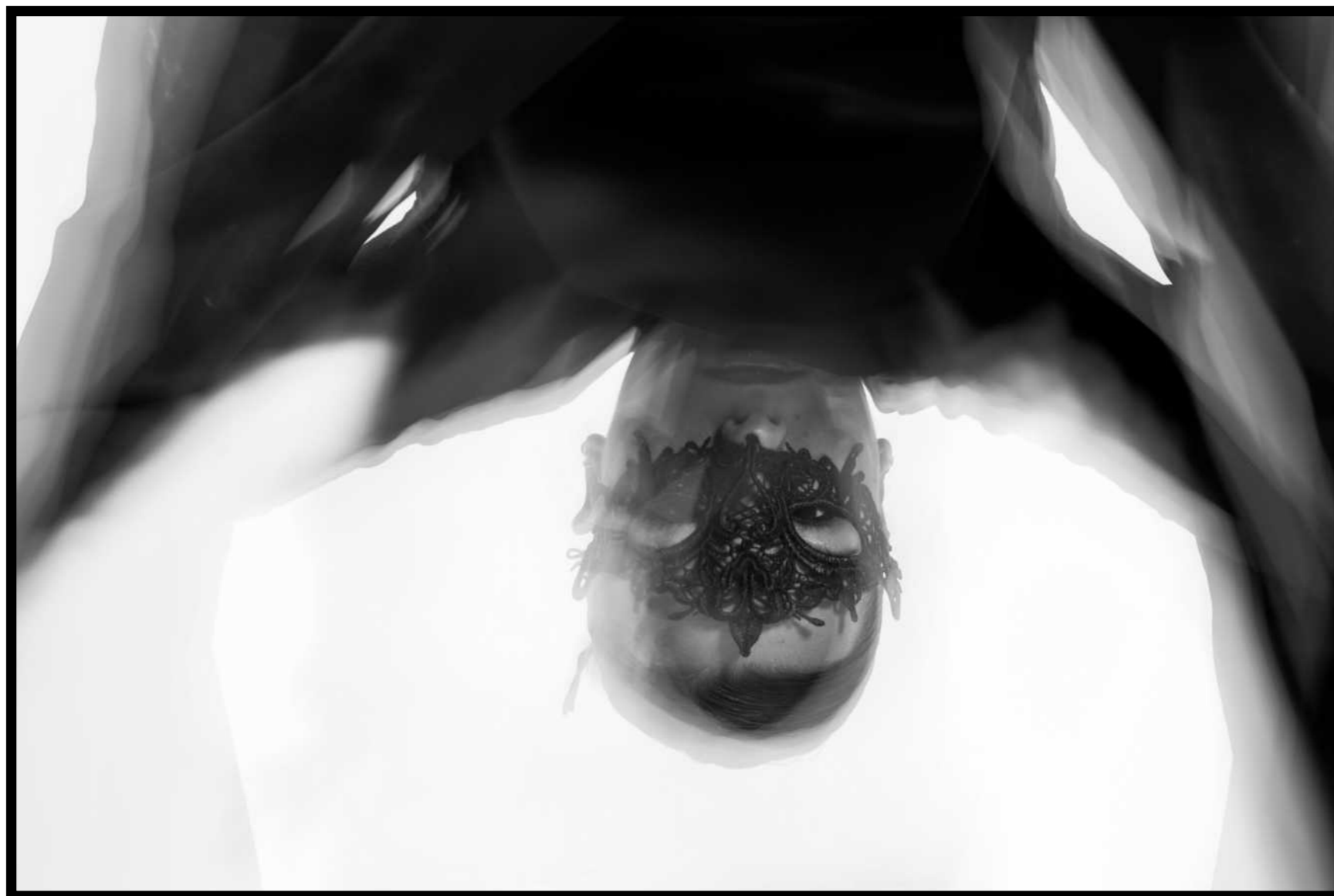
Sandra Cora Aradne Psicológica 2024 Fotografía Digital en estudio