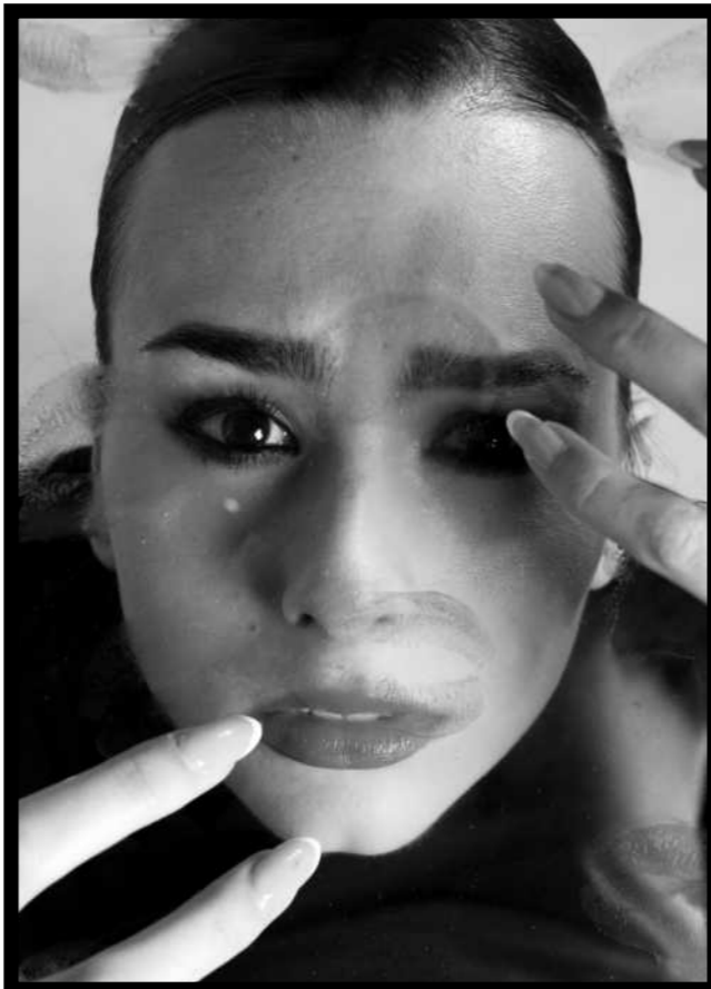
Sandra Cora Autodestrucción 2024 Fotografía Digital en estudio