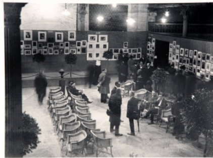
Celebración de Primer Salón Internacional